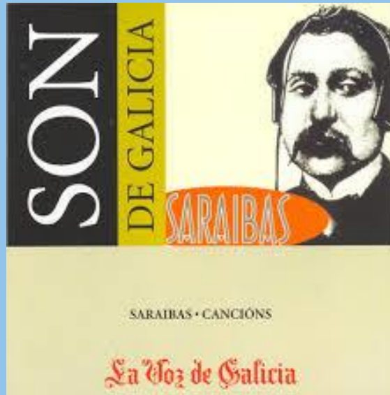
Cancións para un ano (1996)