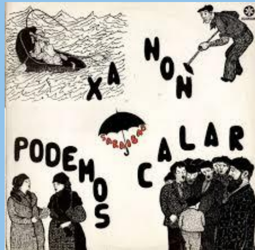
Xa non podemos calar (1981)