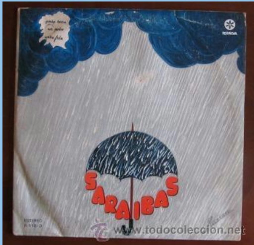
Unha terra ,un pobo, unha fala (1980)

(ESTOS DISCOS NON FORON PUBLICADOS, SON OS EDITADOS)