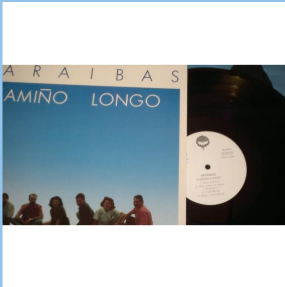
Camiño longo (1991)