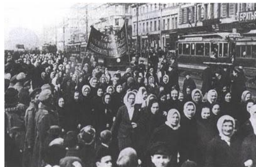
Mulleres rusas en folga

Tamén o 8 de marzo de 1917, como reacción ante os dous milleiros de soldados rusos mortos na guerra, as mulleres rusas declaráronse en folga en demanda de "pan e paz". Catro días despois o Zar abdicou e o goberno provisional concedeu as mulleres o dereito ao voto.